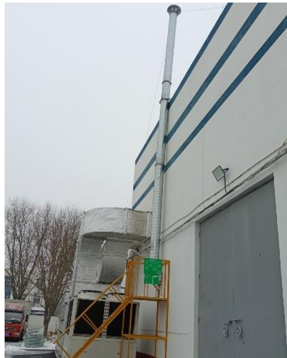
图 3-2 本项目胶膜机擦拭废气净化设施及废气排放口情况