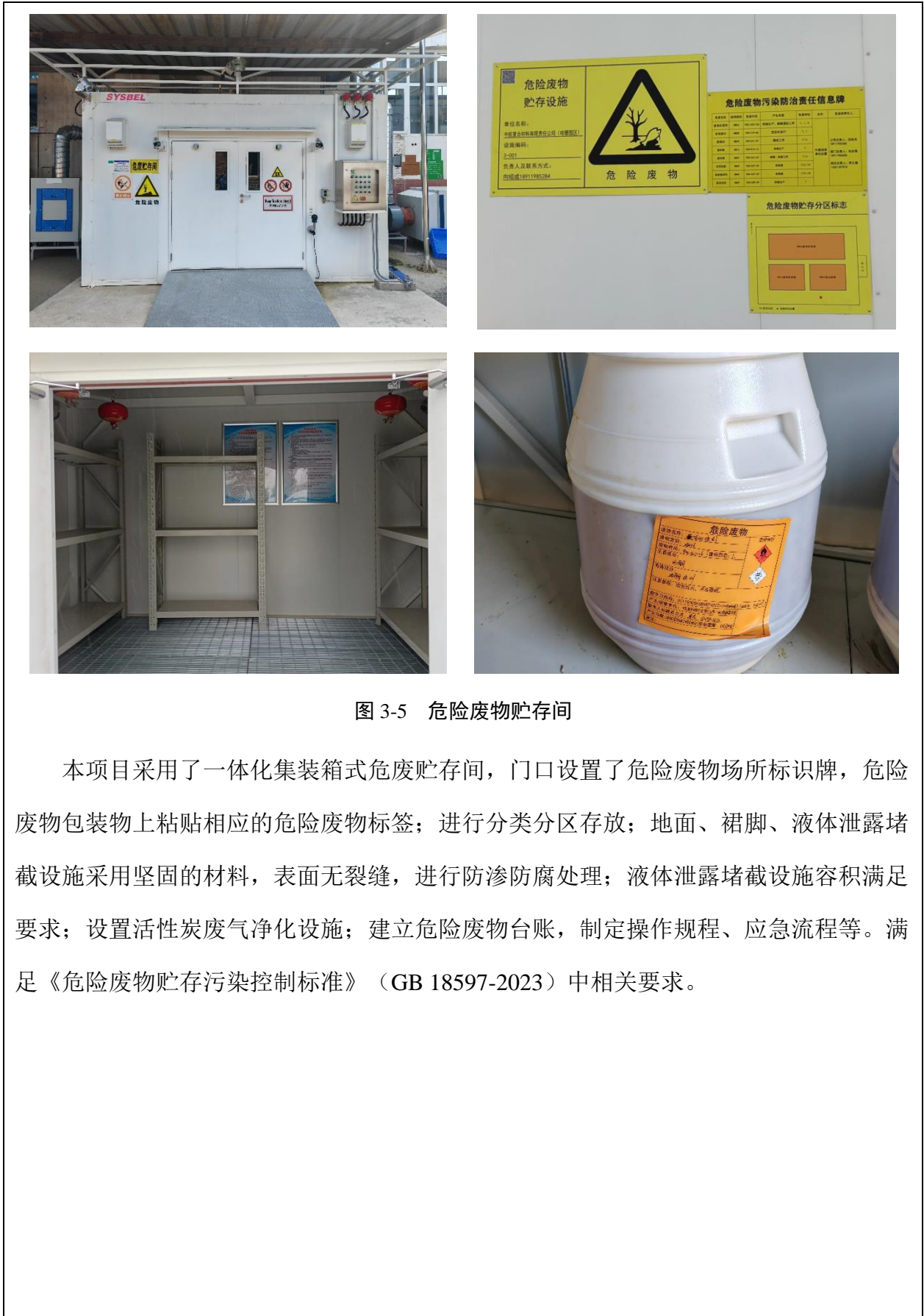
图 3-5 危险废物贮存间

本项目采用了一体化集装箱式危废贮存间，门口设置了危险废物场所标识牌，危险废物包装物上粘贴相应的危险废物标签；进行分类分区存放；地面、裙脚、液体泄露堵截设施采用坚固的材料，表面无裂缝，进行防渗防腐处理；液体泄露堵截设施容积满足要求；设置活性炭废气净化设施；建立危险废物台账，制定操作规程、应急流程等。满足《危险废物贮存污染控制标准》（GB 18597-2023）中相关要求。