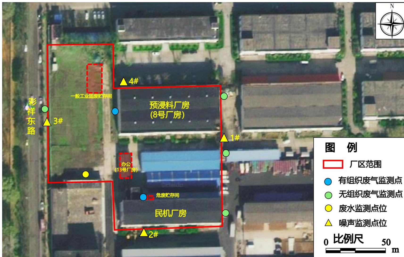
附图4 本项目监测点位图