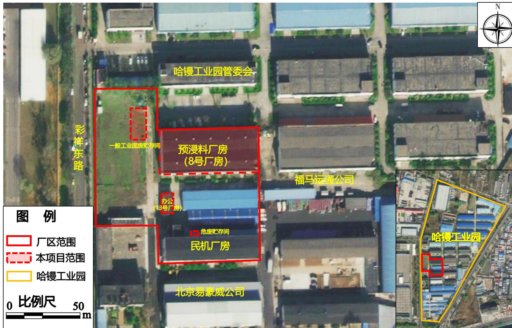
附图2 本项目周边关系图