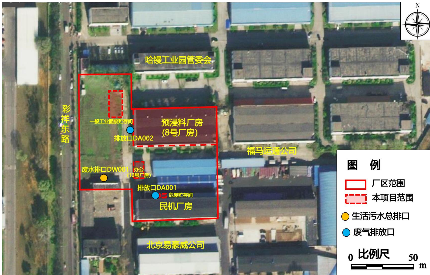
附图3 本项目平面布置图