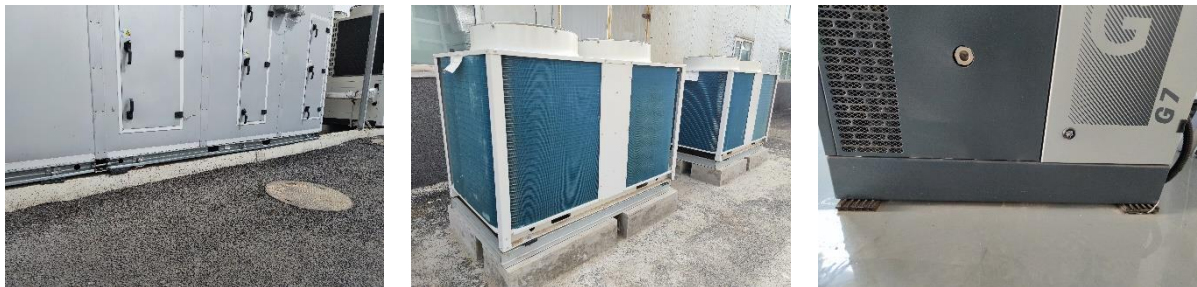
图 3-3 设备基础减振措施