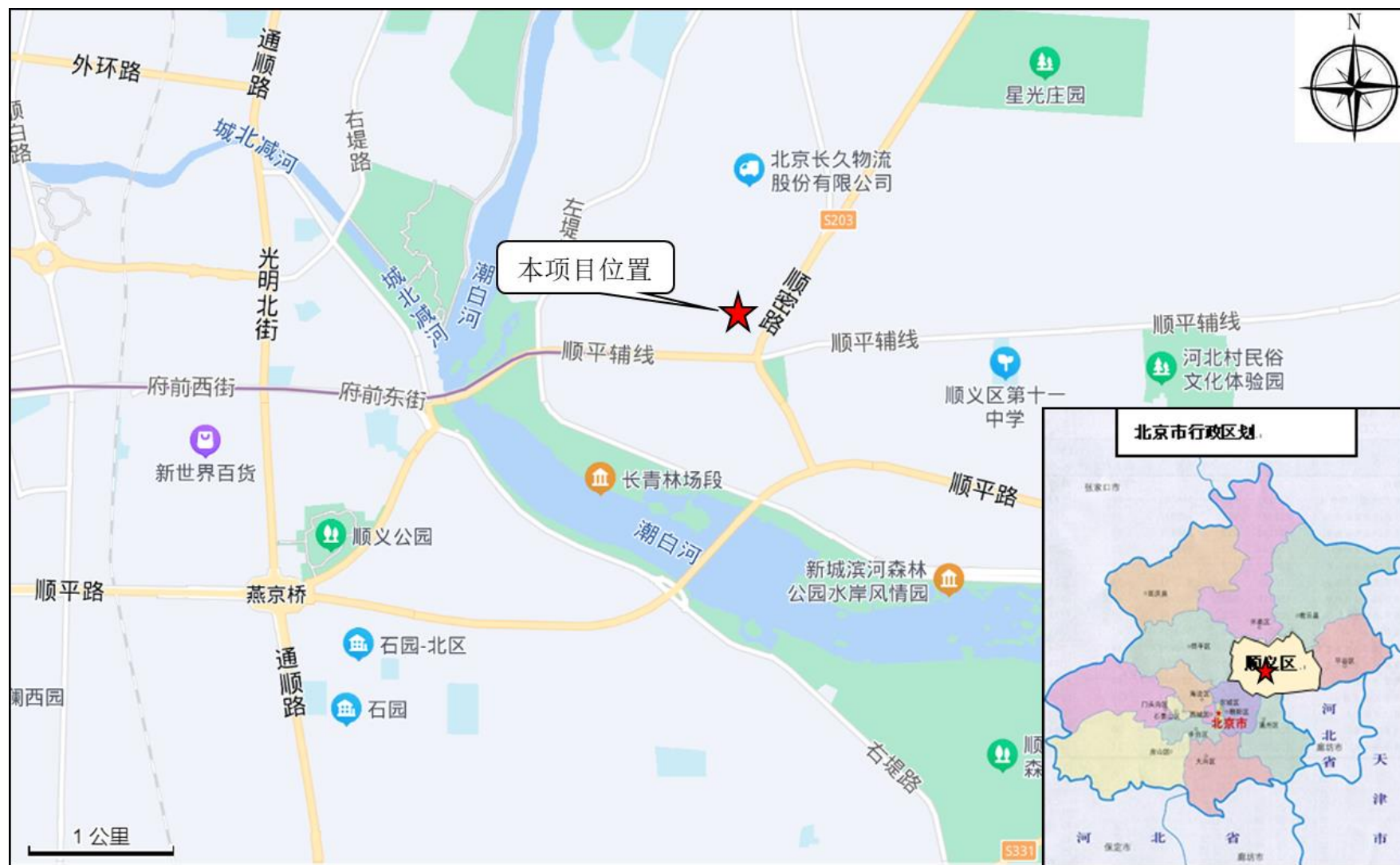
附图 1 本项目地理位置图