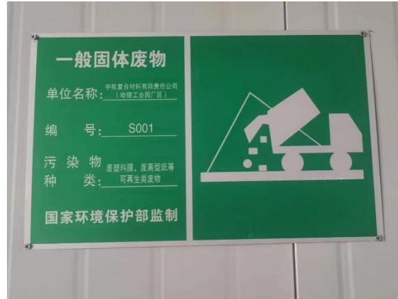
图 3-4 一般工业固体废物贮存间