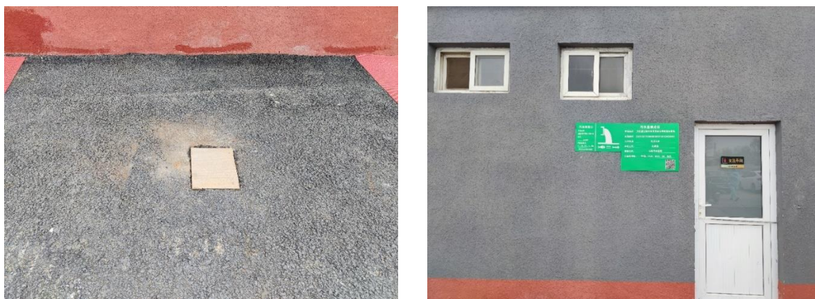
图 3-1 本项目依托化粪池及废水排口情况

本项目生活污水依托工业园区原有化粪池进行预处理，经厂区总排口排入市政污水管网，最终进入北京顺政排水有限公司彩俸小区污水处理站。